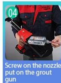
04 Screw on the nozzle, put on the grout gun