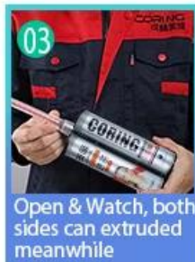
03 Open & Watch, both sides can extruded meanwhile