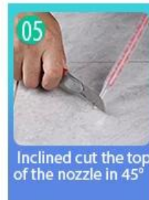
05 Inclined cut the top of the nozzle in 45°