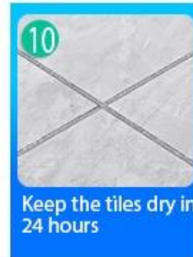
10 Keep the tiles dry in 24 hours