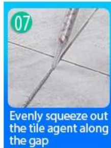
07 Evenly squeeze out the tile agent along the gap