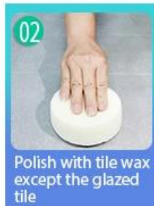
02 Polish with tile wax except the glazed tile