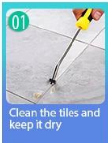
01 Clean the tiles and keep it dry