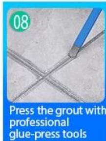
08 Press the grout with professional glue-press tools