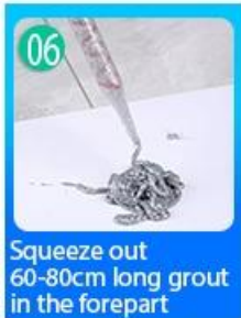
06 Squeeze out 60-80cm long grout in the forepart