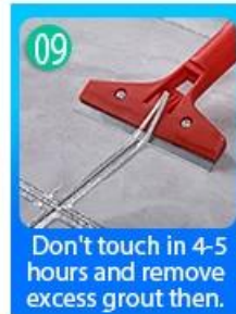
09 Don't touch in 4-5 hours and remove excess grout then.