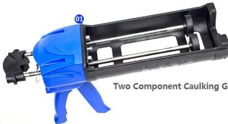
Two Component Caulking Gun