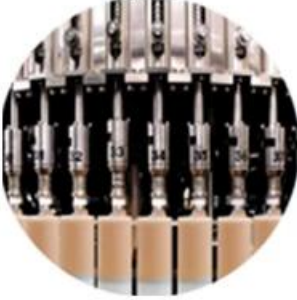
Filling Machine Line