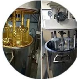
Batching Production Line