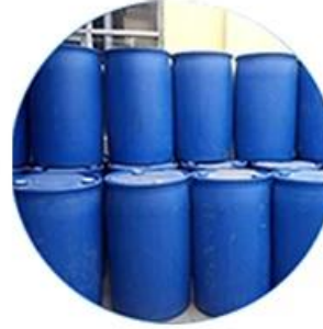
Real Material Stock