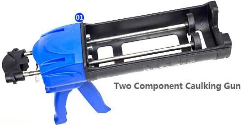
Two Component Caulking Gun